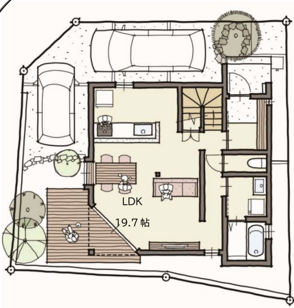
配置図・1階平面図