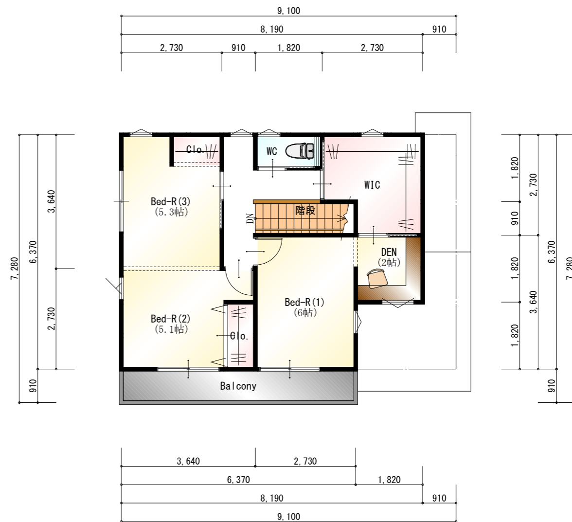
● 2階 平面図 S:1/100