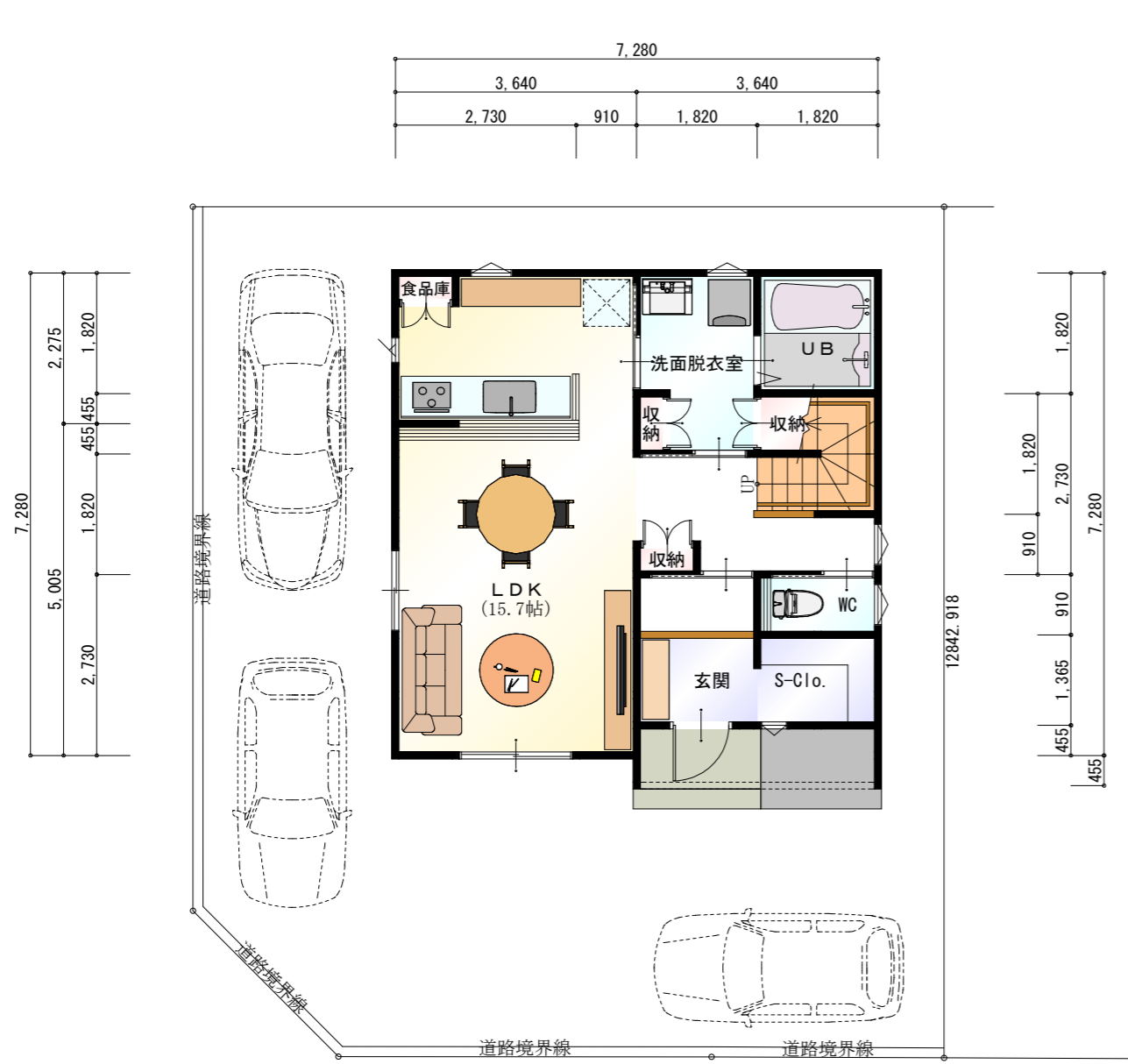
● 1階 平面図 S:1/100