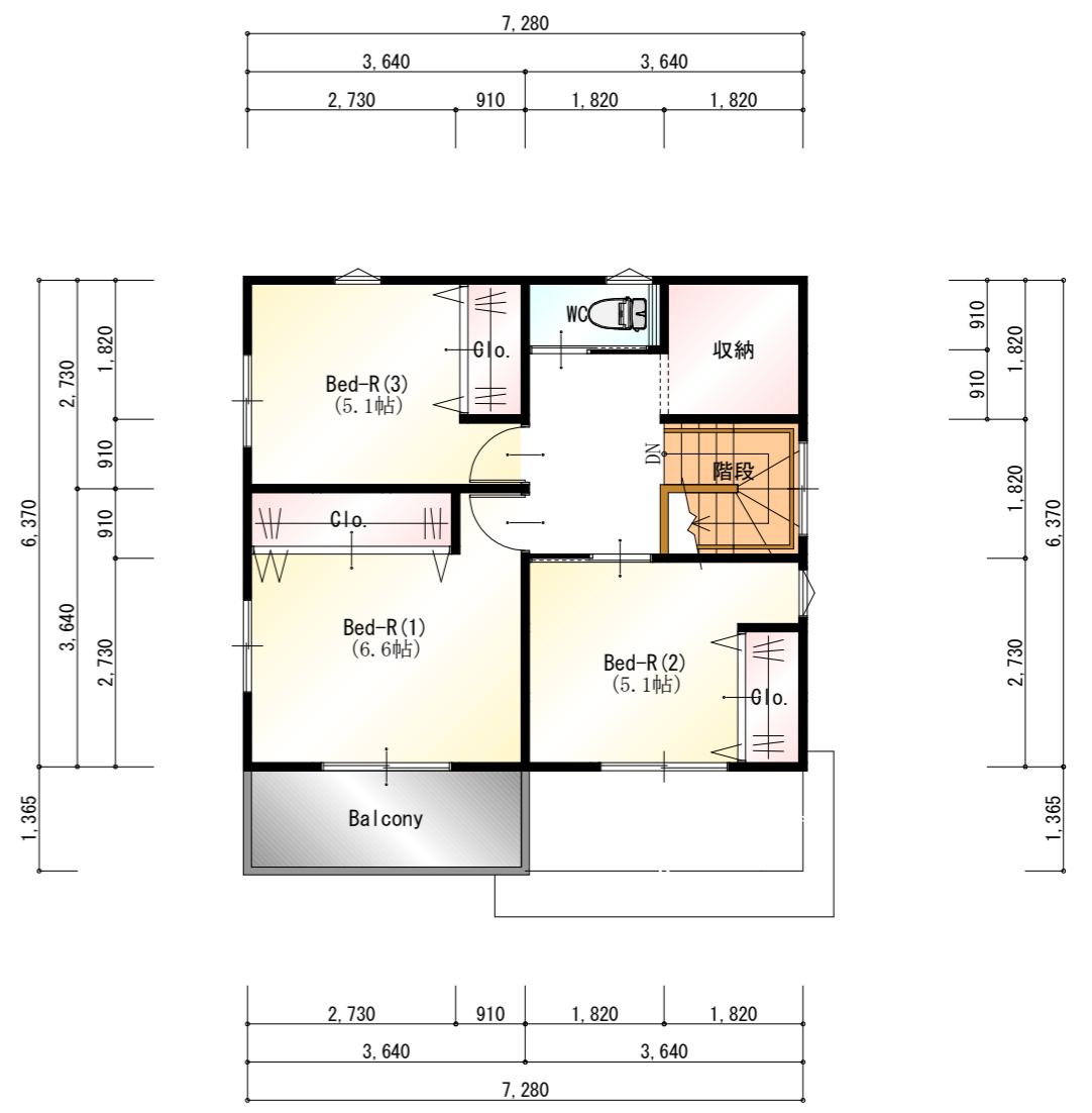
● 2階 平面図 S:1/100