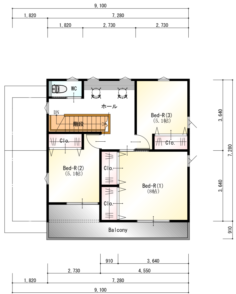
● 2階 平面図 S:1/100