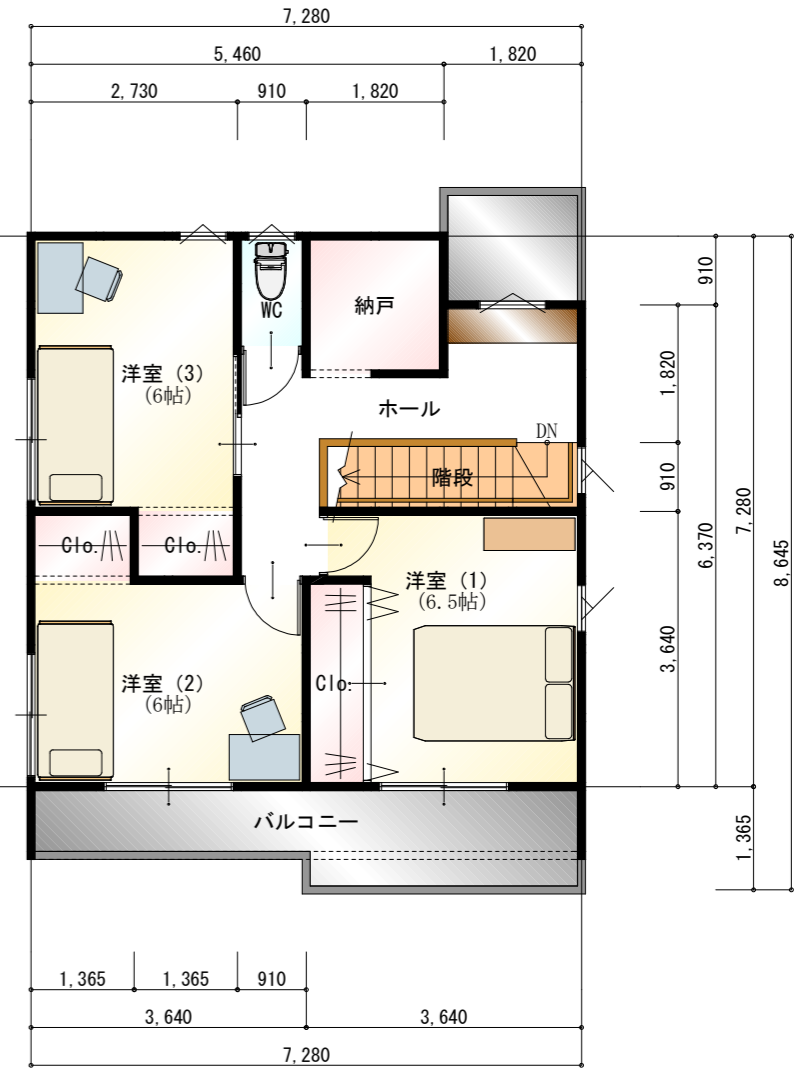
●2階 平面図 S:1/100