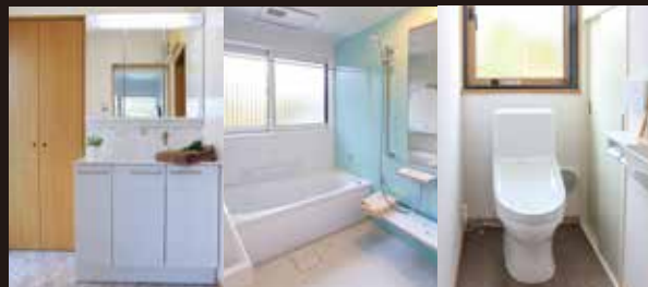
UB、洗面台、トイレは安心のTOTO製品に。