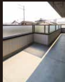
洗濯物もたっぷり干せる広いバルコニー。