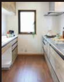
キッチンが清潔感のあるクリナップ製品に。