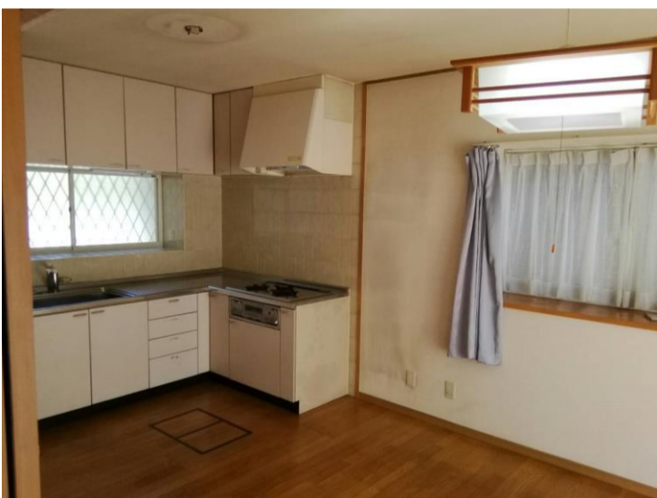
▲使い勝手のいいL型キッチン