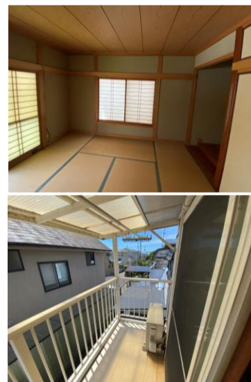
8帖+床の間 本格和室