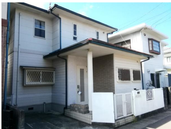
▲玄関ポーチも屋根付きで安心